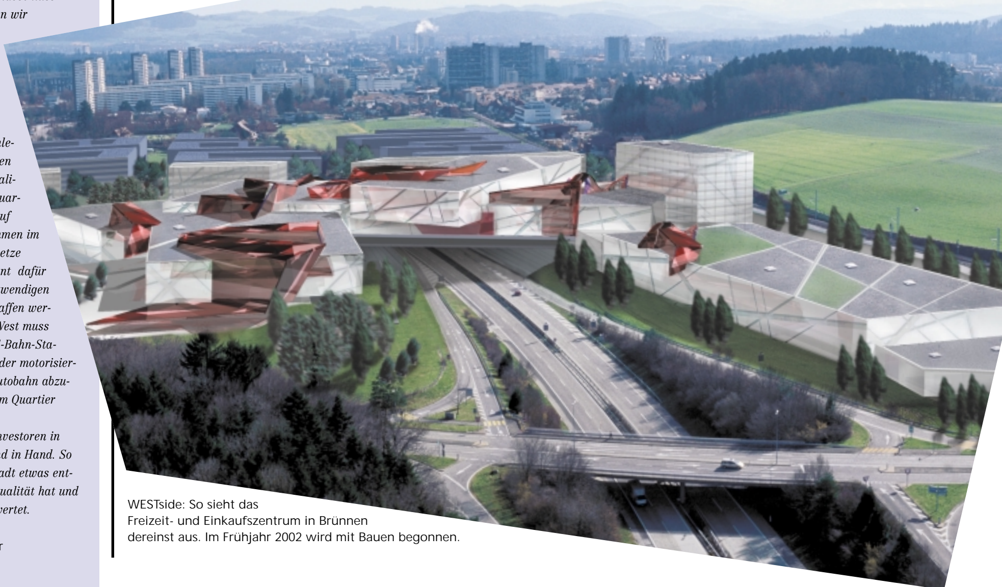
WESTside: So sieht das Freizeit- und Einkaufszentrum in Brünnen dereinst aus. Im Frühjahr 2002 wird mit Bauen begonnen.