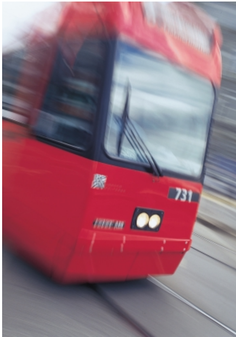
Der öffentliche Verkehr steht im Vordergrund: Brünnen wird mit Bern Mobil und mit der S-Bahn gut erschlossen. So wird Brünnen zum attraktiven Ort zum Wohnen, aber auch für Erholung und Einkauf.

Klar ist die Linienführung von Bus und Tram. Eine der Linien führt mitten durch die Wohnüberbauung Brünnen und endet auf dem Gilberte-de-Courgenay-Platz, direkt bei der S-Bahn-Haltestelle Brünnen. Dort bündeln sich sämtliche Stränge des öffentlichen Verkehrs.